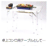
卓上コンロ用テーブルとして...