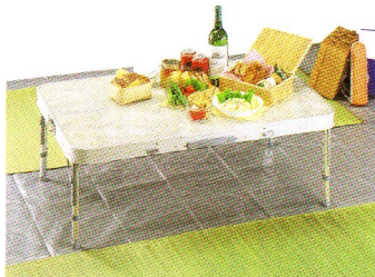
ジョイントパイプでハイテーブルに早変わり!

小売価格 ¥18,000 入数：1(化粧箱入) ▶組立サイズ(約)／テーブル：幅1,000×奥行600×高さ700・260mm、ベンチ：幅900×奥行200×高さ420mm ▶収納サイズ(約)／1,000×105×高さ305mm ▶耐荷重(約)／テーブル：30kg(均等)、ベンチ：1台140kg(片側70kg) ▶セット重量(約)／9.5kg ▶材質／テーブル：甲板の表面材＝合成樹脂化粧合板、構造部材＝アルミニウム合金(表面加工：アルマイト)、ベンチ：構造部材＝座部＞合成樹脂化粧合板、座部の枠・脚部＞アルミニウム合金(表面加工：アルマイト)、張り材＝ポリエステル、クッション材＝ウレタンフォーム POS.No.737395