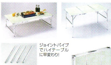
ジョイントパイプでハイテーブルに早変わり!