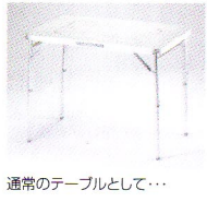
通常のテーブルとして...