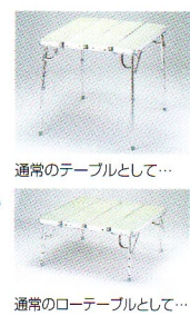
通常のテーブルとして...