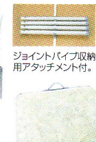
ジョイントパイプ収納用アタッチメント付。