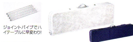
ジョイントパイプでハイテーブルに早変わり!