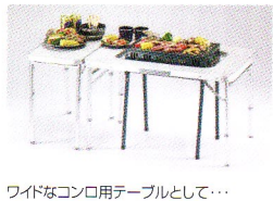
ワイドなコンロ用テーブルとして...