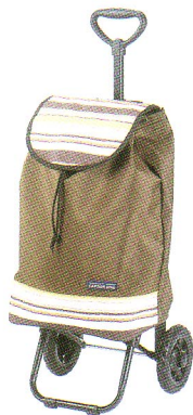
とっては3段階に調節可能。