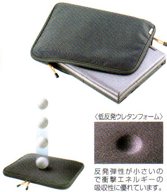
〈低反発ウレタンフォーム〉